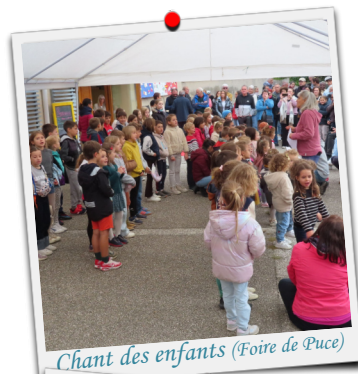
Chant des enfants (Foire de Puce)