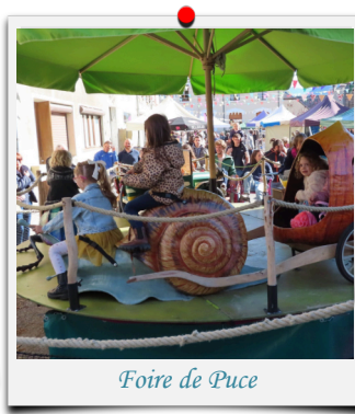
Foire de Puce