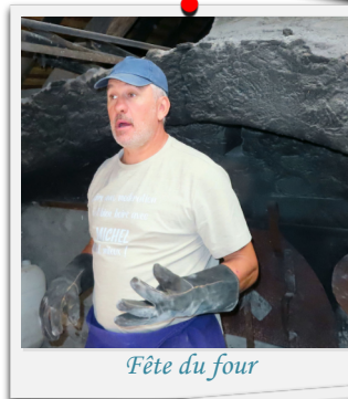
Fête du four