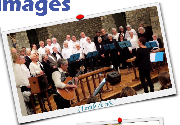
Chorale de Noël