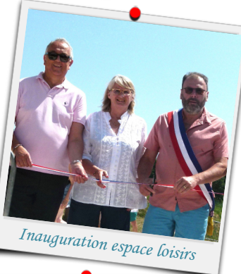
Inauguration espace loisirs