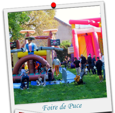
Foire de Puce