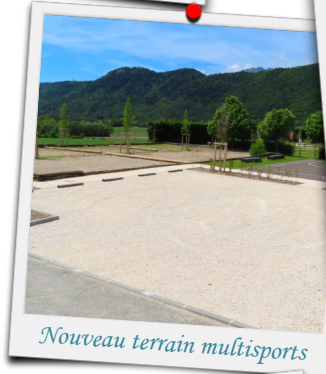
Nouveau terrain multisports