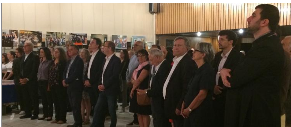
Au sein de la MCA GD, les membres de l'association arménienne, entourés d'élus.